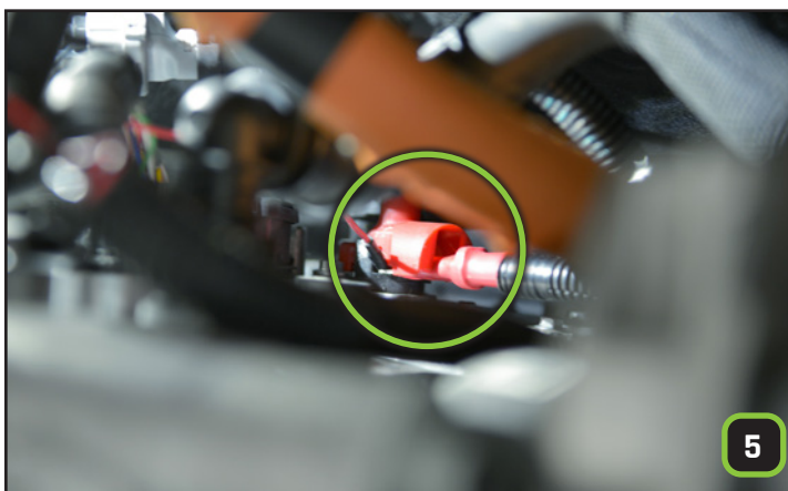
Die markierte Kunststoffabdeckung entfernen. (in der Nähe des Elektromotor-Steckers)