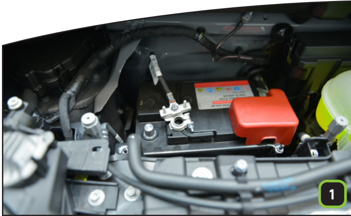
Motorhaube öffnen und Batterie trennen! Nie mit einer angeschlossenen Batterie den Einbau beginnen!