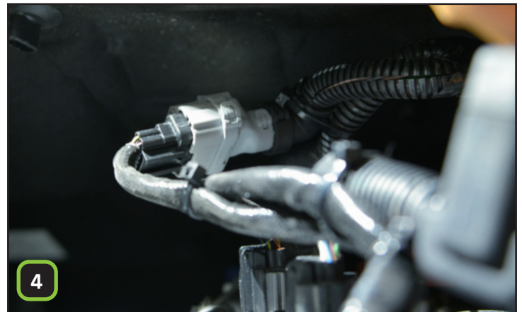
Den STEINBAUER Kabelsatz zwischenstecken.