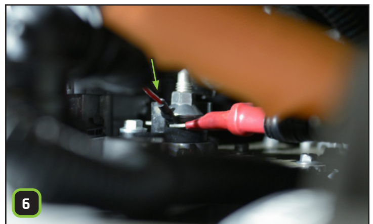
Die rote Leitung des STEINBAUER Kabelsatzes unter der Schraube anschließen, dann die Kunststoffabdeckung wieder anbringen.